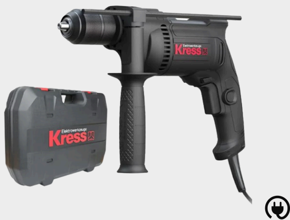
0026943475865504 BERBEQUIM C/ PERCURSSÃO 650W (KUY02P)