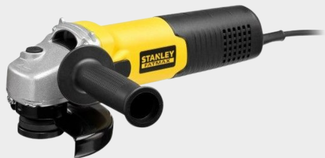
0045035048748855 REBARBADORA 1100W 125mm