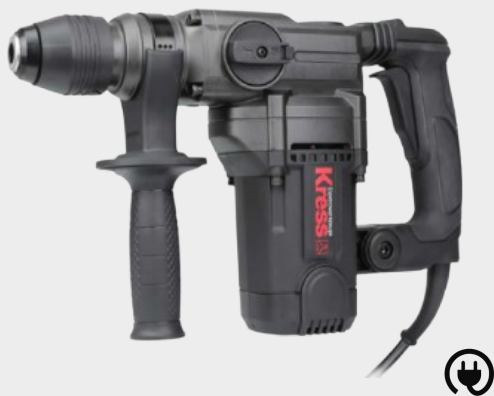
0026943475865146 MARTELO PREFURADOR - 1100W - 5J SDS-PLUS (KUX15P)