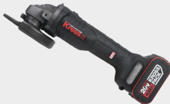
0026943475876463 REBARBADORA BRUSHLESS 20V 125mm 3 VELOCIDADES (KUH10.2)