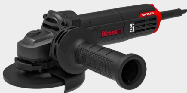
0026925387177906 REBARBADORA 1200W 125mm BRUSHLESS (KUS26)