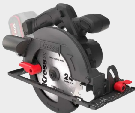
0026943475891800 SERRA CIRCULAR Ø165mm (KUE12.1)