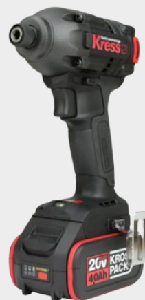
0026943475864934 APARAFUSADORA DE IMPACTO 230NM (KUB60.91)