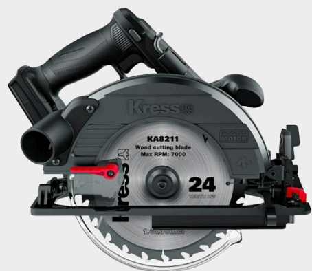
0026925387198871 SERRA CIRCULAR Ø185mm (KUE15)