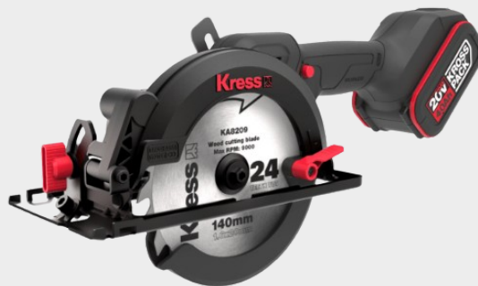
0026943475890872 SERRA CIRCULAR Ø140mm (KUE11)