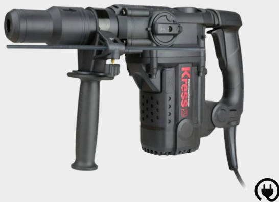
0026943475865153 MARTELO PREFURADOR - 1050W - 7,5J SDS-MAX (KUX21)