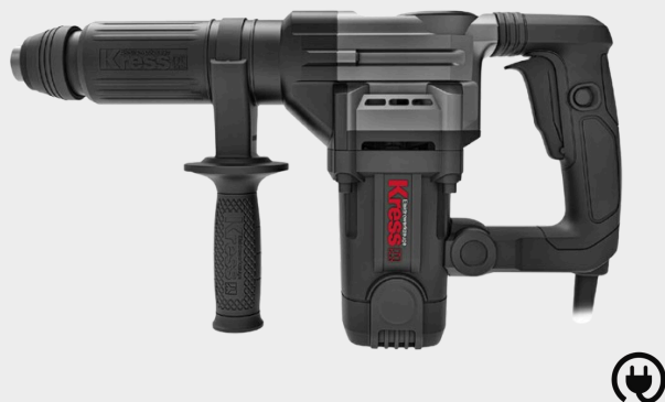
0026943475865160 MARTELO DEMOLIDOR - 1200W - 14J SDS-PLUS (KUX35P)